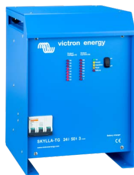
Skylla TG 24 50 3-Phase