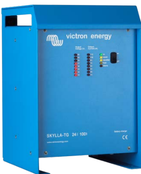
Skylla TG 24 100