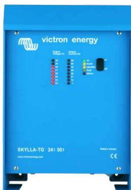
Skylla TG 24 50